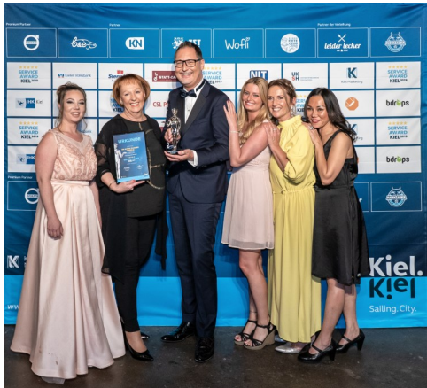
So sehen glückliche Gewinner*innen aus : Preisverleihungsgala 2019

2010 wurde das Projekt von Kiel-Marketing ins Leben gerufen. Seitdem wurden fünf Mal die servicefreundlichsten Unternehmen Kiels aus sechs unterschiedlichen Branchen gewählt und mit dem silbernen Service-Fiete ausgezeichnet - das letzte Mal 2019.